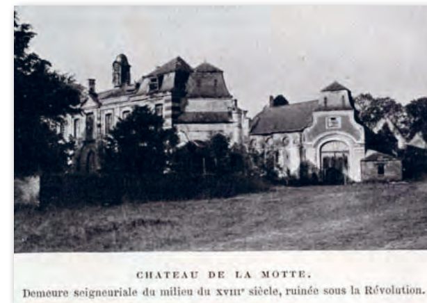
CHATEAU DE LA MOTTE. Demeure seigneuriale du milieu du XVIII e siècle, ruinée sous la Révolution.