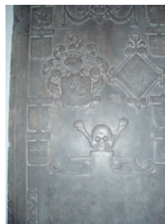
Pierre tombale de la famille le Rousseau

Bousval en balade : mai 2021 Copyright : Colette Wibo & Ghislain Grégoire Chemins 141 www.chemins141.be Editeur responsable : M. Fourny mfourny@skynet.be