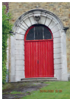
Portail d'entrée de la chapelle de Noirhat

Un édicule lui est consacré à la rue du Sablon (voir Circuit n° 5 - Promenade de Noirhat ).