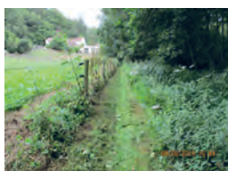
Sentier de la Fontaine Fauconnier ( n° 52 )