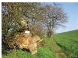
Sentier de Laloux ( n° 62 )