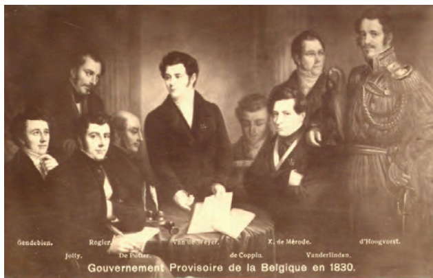
Le Gouvernement provisoire E. d'Hooghvorst est en uniforme à droite de la gravure.