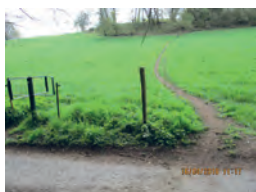
Sentier de Couture ( n° 46 )