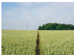
Sentier du Bois de la Grange ( n° 44 )