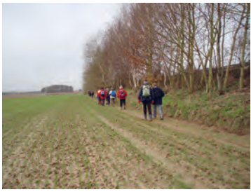
Drève Bousval à Baisy-Thy