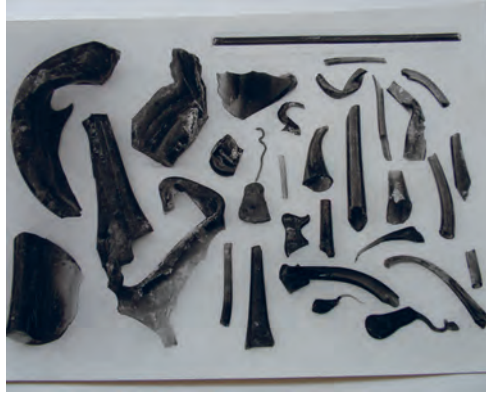
Pièces et coulées de verre retrouvées au Sclage dans les années 1950

Bousval et Cérroux-Mousty virent s'installer des verreries fondées par les familles Colnet et de Ferri (seigneur de Moriensart), l'une originaire de Thiérache et l'autre provenant du Hainaut. Ils produisirent du menu verre (gobelets). Les maîtres verriers de Hennezel, originaires de Lorraine, exploitèrent des fours à grand verre (verre plat) à Wez. En 1621, ils furent bannis comme réformés par les archiducs Albert et Isabelle.