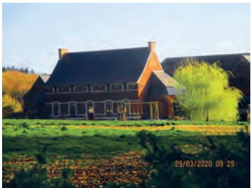
Ferme d'Agnissart à Baisy-Thy