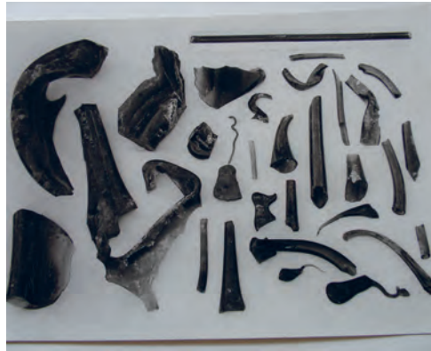
Pièces et coulées de verre retrouvées au Sclage dans les années 1950

Bousval et Céroux-Mousty virent s'installer des verreries fondées par les familles Colnet et de Ferri (seigneur de Moriensart), l'une originaire de Thiérache et l'autre provenant du Hainaut. Ils produisirent du menu verre (gobelets). Les maîtres verriers de Hennezel, originaires de Lorraine, exploitèrent des fours à grand verre (verre plat) à Wez. En 1621, ils furent bannis comme réformés par les archiducs Albert et Isabelle.