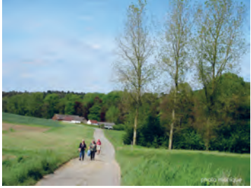
Ferme Del Wastez à Baisy-Thy