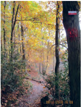
Sentier à flanc de coteau de la Bruyère Delvigne

Bousval et Céroux-Mousty virent s'installer des verreries fondées par les familles Colnet et de Ferri (seigneur de Moriensart), l'une originaire de Thiérache et l'autre provenant du Hainaut. Ils produisirent du menu verre (gobelets). Les maîtres verriers de Hennezel, originaires de Lorraine, exploitèrent des fours à grand verre (verre plat) à Wez. En 1621, ils furent bannis comme réformés par les archiducs Albert et Isabelle.