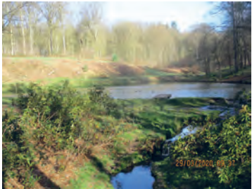
Dans le bois du Ruart