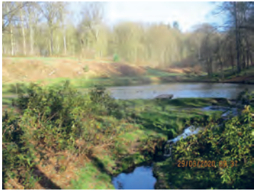
Dans le bois du Ruart