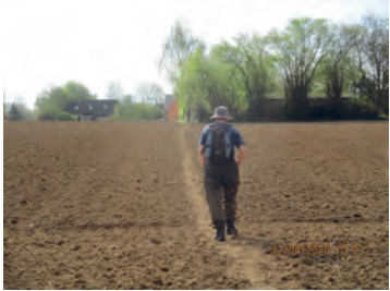
Sentier du Charlier (n° 101)