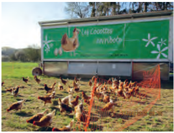
Poulailler mobile au champ du Tombois