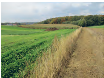
Sentier de Saint-Hubert (n° 81 à Bousval)