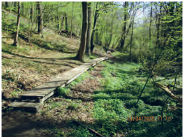
Caillebotis au sentier des Prés Saint-Jean (n° 83)