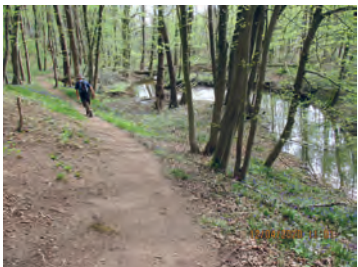
Ri d'Hez, affluent de la Thyle