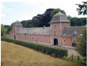
Château de Thy