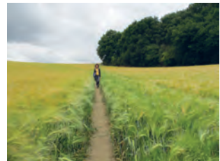
Sentier de Saint-Roch ( n° 96 )