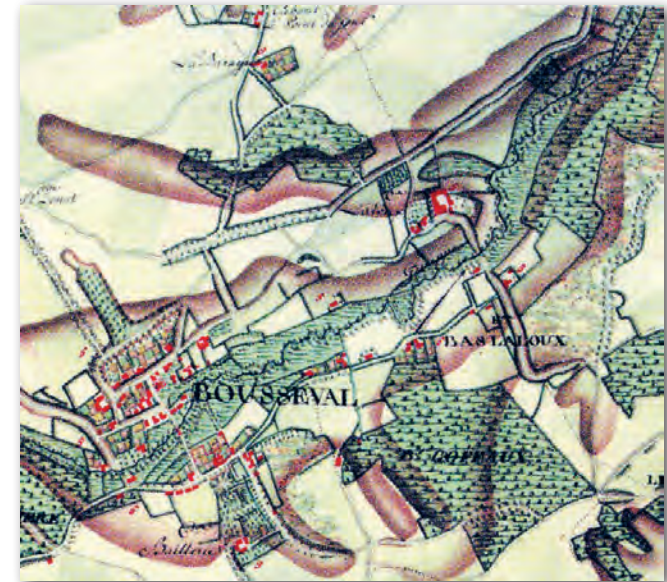
La Dyle et les marais (Extrait de la carte de Ferraris, 1770)

Le chemin des Grands Fossés est taillé sur le versant escarpé de la vallée de la Dyle. Jadis, la rivière ondoyait en de nombreux méandres bordés de vastes marais. La carte de Ferraris (1770) met en évidence le relief (en brun) et les étendus marécageuses (en vert foncé avec fins tirets) qui recouvraient le fond de la vallée, sillonné par le cours d'eau qui perd environ 15 mètres d'altitude sur le territoire de Bousval.