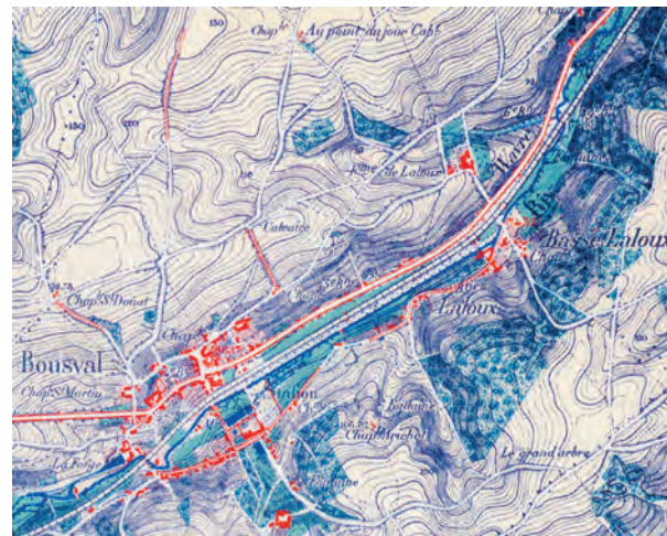
La Dyle, le chemin de fer et la chaussée provinciale (Carte du Dépôt de la Guerre, 1870)

La rectification du cours de la Dyle intervint lors de la construction de la ligne de chemin de fer (1855) en même temps que l'assainissement des marais. Le long de la rivière, des moulins à eau actionnaient des meules, makas et martinets (marteaux), une soufflerie et un bocard (pilon).