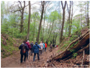
Chemin de la Tassenière ( n° 7 à Baisy-Thy )

Le blason de Philippe II, roi d'Espagne en 1555, montre ses nombreux titres, acquis en Espagne, Sicile, Touraine, Autriche, Bourgogne, Flandre, Brabant, et Bavière.