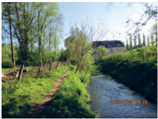
La Dyle le long du sentier des Marais du Moulin ( n° 89 )