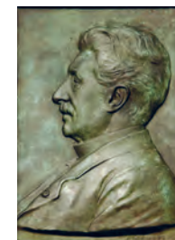
Emile Henricot Bronze de Godefroid Devreese, 1911

Les usines Henricot cessent leurs activités en 1984.