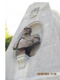
Comte A. Goblet d'Alviella Buste de Jef Lambeaux, 1887