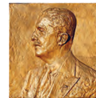
Paul Henricot Bronze d'Alfred Courtens, 1940

Il est particulièrement remarquable d'y admirer le nombre et la qualité des œuvres de grands artistes belges à la charnière des XIX e et XX e siècles.