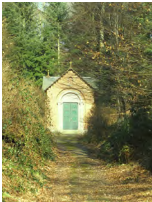
6. La chapelle de Montaigu (1843)