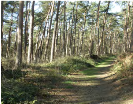
2. Le chemin du Ruart (n° 7)