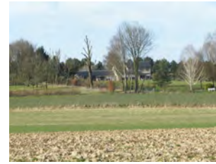
15. Sentier de la Chiffane (n° 26) à travers champs