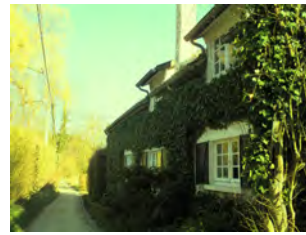
13. Rue E. Bouvier