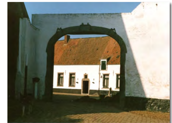
Portail d'entrée de la ferme Chiffane

L'ancienne ferme de Glabjou avec la belle grange datant de la fin du XVIII e siècle et reprise dans le patrimoine monumental de Belgique. Cette grange a été récemment démolie pour laisser la place à un hôtel.