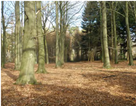
4. Sentier du Calvaire (n° 27)