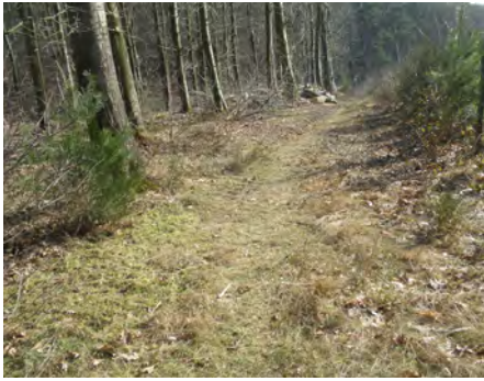
1. Sentier de Quéwet (n° 23)