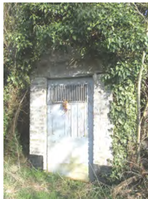
18. Chapelle Notre-Dame de Hal et de Lourdes érigée par Alexandre Fievez