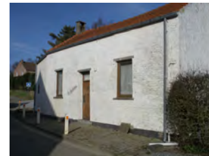
19. La Chaumière