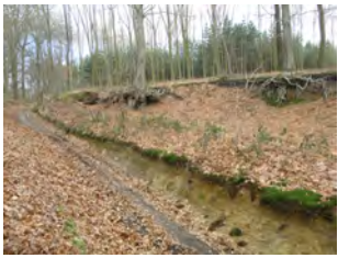
5. Le chemin du Ruart