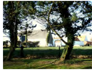
17. Ferme de la Chiffane (1744)