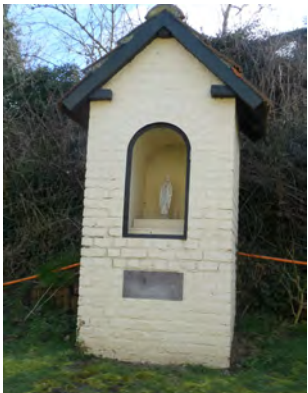
10. Chapelle Notre-Dame de Lourdes à Glabjou