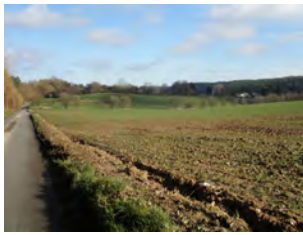
12. Rue E. François. Vue vers la Basse Hutte