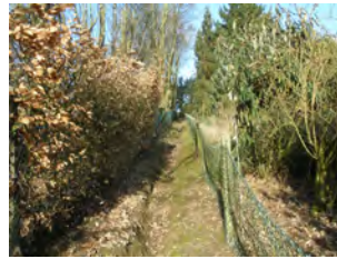
16. Sentier de la Chiffane entre haies et jardins