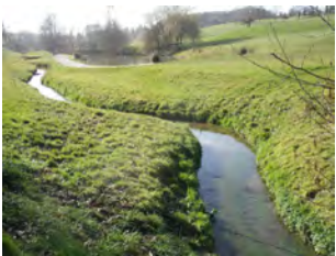
9. Le Cala traverse un terrain de golf.