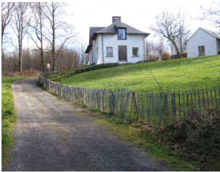
3. Ancienne maison du garde, à la Basse Hutte