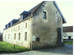
11. Corps de logis de l'ancienne ferme de Glabjou