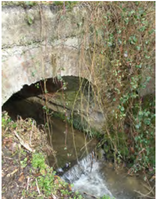
7. Ancien pont de pierre sur le Cala