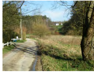
14. Rue E. Bouvier