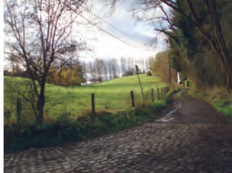
Chemin de l'Alfer ( n° 34 )