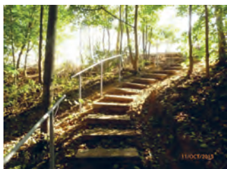
Chemin du Bosquet ( n° 25 )