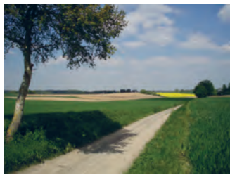
Le Blanc Champ au chemin de Wavre ( n° 2 )