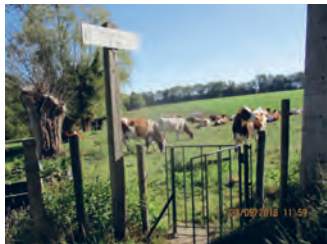
Sentier Draye ( n° 55 )