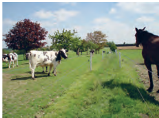
Sentier du Point du Jour ( n° 61 )