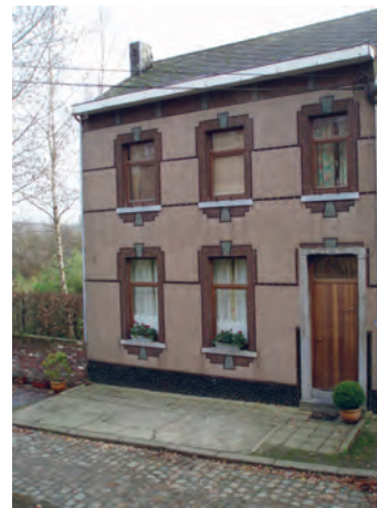
Façade en marbrite et cimorné à la rue Haute