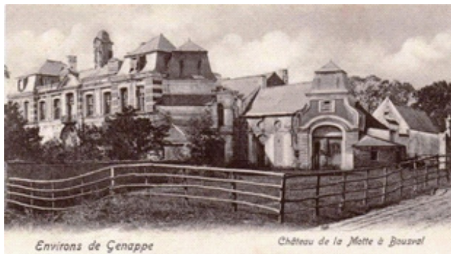
Les ruines du château de la Motte (vers 1910)

Départ / Arrivée : drève Dom Placide à Bousval