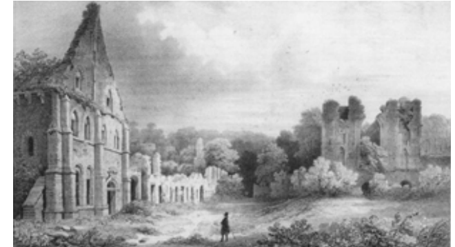
Les ruines de Villers - Dessin de V. Hugo (1865)

Au début du XX e siècle, les ruines imposantes de l'abbaye de Villers et du château de la Motte attirent les visiteurs. Les touristes profitent du chemin de fer, avec halte à Noirhat, pour se promener à la découverte des lieux.