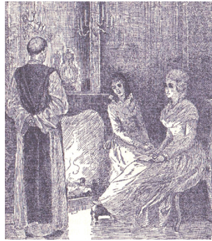
Dom Placide au château de la Motte Illustration extraite de l'ouvrage de E. Van Bommel (1875)

Traverser le carrefour de l'avenue de la Motte et poursuivre en face dans le chemin de Wavre. Celui-ci s'incurve à gauche. Le quitter par la droite dans la drève du château de la Motte. Remonter le long du mur du château. Immédiatement après la rue du Sablon qui s'ouvre à droite, une sente étroite apparaît après une belle chapelle baroque. Elle permet d'éviter